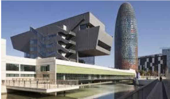
museu del disseny (plaça de les Glòries)

sortida (9.15 h) i arribada (21.30 h) estació autobusos Tàrrrega